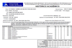
image001.jpg 53 KB

Antes de imprimir, pense em sua responsabilidade com o meio ambiente.