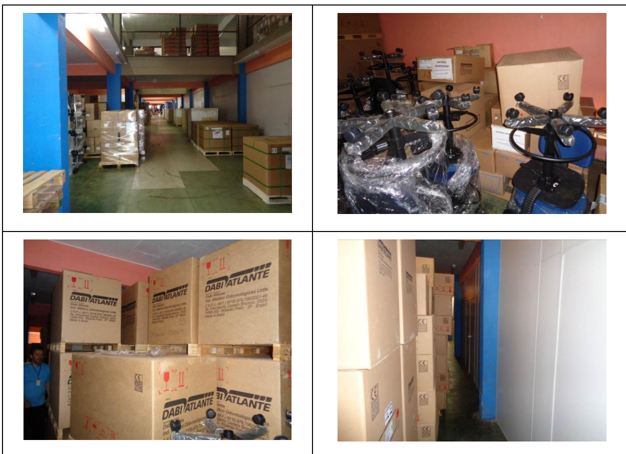
Figuras 4 a 7: Corredor e salas com bens móveis no Parque de Apoio

237. Um segundo aspecto que merece análise é a falta de monitoramento eletrônico . Não existem câmeras de segurança em nenhum dos três depósitos destinados à guarda de bens permanentes. Um efetivo sistema de monitoramento,