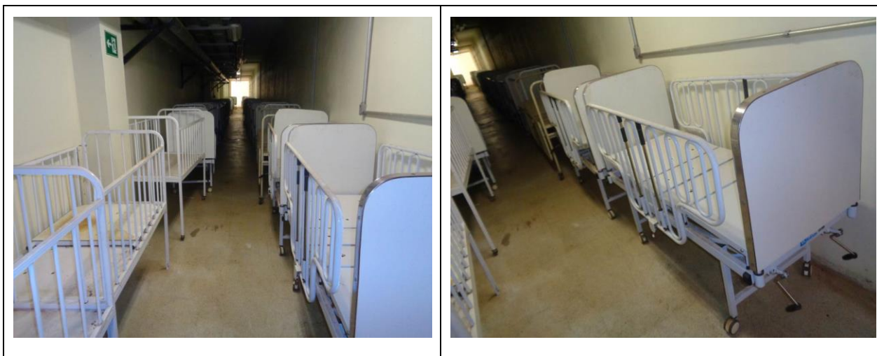
Figuras 11 e 12: Camas de berço hospitalar estocadas no HRSM

255. Adicionalmente, por meio do Ofício nº 475/2016-MPC/PG, de 03/10/2016 (e-DOC F56EC52E-e), e seu Anexo (e-DOC 94CBB587-e), tomou-se conhecimento de bens da SES-DF estocados no Hospital Regional de Samambaia – HRSam, os quais estão sem número de patrimônio, aguardando pelo processo de incorporação. Assim, fica nítida a necessidade de a SES-DF mitigar ou eliminar essa dispersão na guarda de bens permanentes, e, ainda, aperfeiçoar o controle patrimonial pela DPAT (e-DOC 94CBB587-e, p. 15).