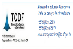
image009.png 28 KB