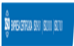
image005.png 13 KB