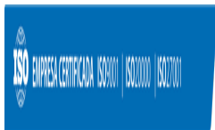
image007.png 16 KB