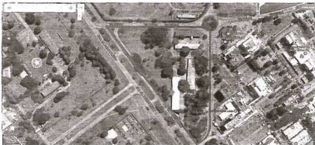
Figura 2 – imagem aérea da área destinada à implantação do crematório (setor Itapoã).

160. O referido plano elenca em seu item 3 79 (Plano de Obras) as especificações para a implantação do crematório, contendo a descrição das principais características dos fornos e da infraestrutura projetada necessária para o seu funcionamento. Após, estipulou o prazo de 2 (dois) anos para a conclusão e entrada em operação das obras lá indicadas, dentre as quais se inclui o crematório.