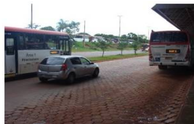
Figura 8: Veículo circulando na área restrita aos ônibus do Terminal Asa Sul.

54. Outros fatores que, na opinião dos encarregados da gestão dos terminais, podem comprometer a segurança nos terminais de passageiros são: problemas nos extintores de incêndio, vigilantes em número insuficiente, luminárias desprendendo, fiação exposta, ocorrência de curto circuito, iluminação precária nas imediações, entre outros.