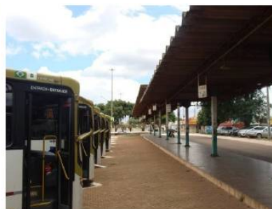
Figura 2: Cobertura Insuficiente do Terminal Ceilândia P Norte

33. Juntos, esses terminais, nos quais foram evidenciadas as piores condições, representam 22,6% dos terminais avaliados.