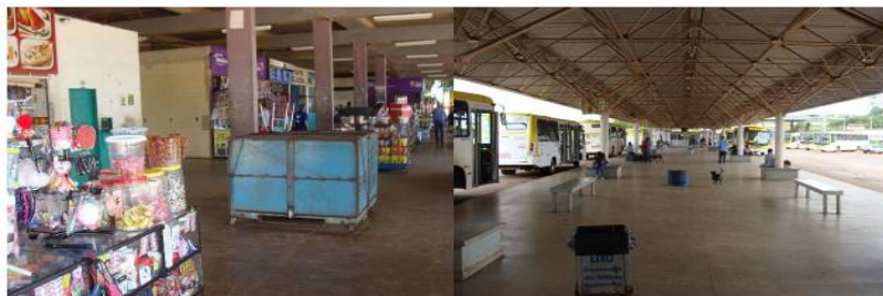
Figura 11: Obstáculos da Rodoviária de Brazlândia

59. Esses números se invertem quanto à acessibilidade para deficientes visuais: as condições são boas em doze terminais (38,7%) e inadequadas em 19 (61,3%).