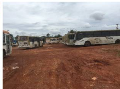
Figura 14: "Pavimento" do Terminal da Asa Norte

67. A presença de vazamentos de água ou entupimentos da rede de esgoto foi apontada em quase metade dos terminais visitados (15 dos 31).