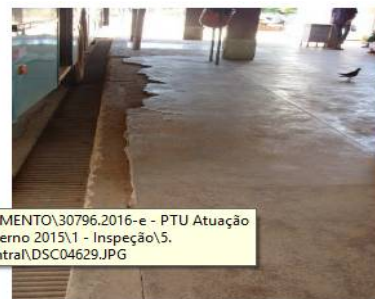
Figura 16: Meio-fio da Rodoviária de Braziliândia

69. Sugere-se, por isso, determinar à Semob e à DFTrans , de forma conjunta e dentro das respectivas competências, a adoção de providências para assegurar a execução das atividades de conservação e manutenção dos terminais de forma a manter boas condições no piso da plataforma de embarque/desembarque, nos revestimentos das paredes, nos pavimentos de circulação de ônibus, nos meios-fios da plataforma, bem como realizar a manutenção preventiva e corretiva para evitar e corrigir a ocorrência de vazamentos de água ou entupimentos da rede de esgoto.