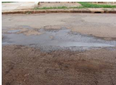
Figura 13: Pavimento do Terminal de São Sebastião