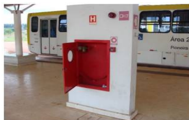
Figura 9 - Ausência de hidrante e extintor de incêndio no Terminal Gama Sul

54. Outros fatores que, na opinião dos encarregados da gestão dos terminais, podem comprometer a segurança nos terminais de passageiros são: problemas nos extintores de incêndio, vigilantes em número insuficiente, luminárias desprendendo, fiação exposta, ocorrência de curto circuito, iluminação precária nas imediações, entre outros.