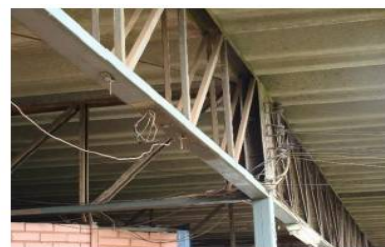
Figura 10 - Fiação exposta no Terminal de Sobradinho Centro

55. Em face disso, sugere-se determinar à Semob e à DFTrans , de forma conjunta e dentro das respectivas competências, a adoção de providências necessárias para adequação dos terminais de ônibus do DF, de modo a garantir, em todos os terminais, condições adequadas de segurança aos usuários, em especial, dotando os terminais de iluminação suficiente e adequada, de espaço bem definido e identificado para embarque/desembarque, com limitadores de estacionamento, evitando a ocorrência de inundações no interior dos terminais, coibindo a presença de veículos particulares na área exclusivamente destinada ao STPC/DF e corrigindo os problemas apontados de infraestrutura, de carência de extintores de incêndio e de pessoal que podem prejudicar a segurança dos usuários.