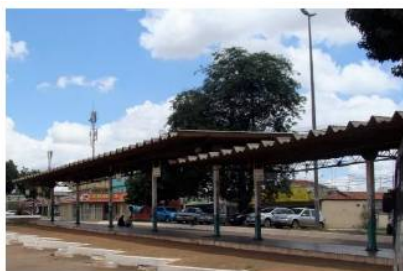
Figura 3 - Ausência de bancos no Terminal de Ceilândia P Norte.

39. Dos terminais visitados, 80,6% oferecem assentos em quantidade suficiente para os usuários. Em três terminais (9,7%), o número de bancos é insuficiente, com destaque para a Rodoviária do Plano Piloto, onde é considerável o número de passageiros em pé. Em outros três terminais (9,7%) – Ceilândia P Norte, Mini Terminal de Sobradinho e Terminal da Asa Norte – sequer há bancos.