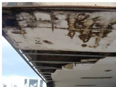
Figura 1: Estrutura do Teto da Rodoviária do Plano Piloto

32. O estado mais crítico foi verificado nos Terminais de Ceilândia P Norte, Sobradinho Centro e Mini Terminal de Sobradinho, cujas fragilidades comprometem a funcionalidade da cobertura. Nos Terminais Brazlândia Setor Tradicional, Asa Norte, Gama Central e Rodoviária do Plano Piloto, as estruturas também mostram-se bem precárias, já chegando a comprometer a finalidade da cobertura.