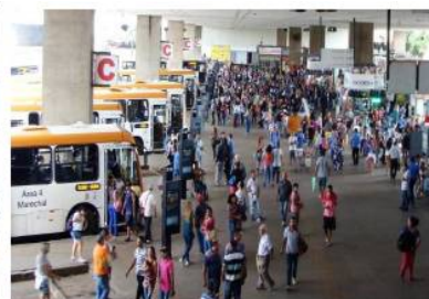
Figura 4: Insuficiência de bancos na Rodoviária do Plano Piloto

40. Sobre os banheiros , foi verificada a existência de problemas estruturais, entupimentos, descarga sem funcionar, ausência ou defeito no assento/tampa do sanitário e nas divisórias e portas.