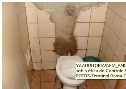
Figura 15: Vazamento de água e Entupimento do Terminal do Gama Centro

68. Quanto aos meios-fios da plataforma , apurou-se boas/excelentes condições em apenas dezesseis terminais (51,6%). Nove estavam em situações razoáveis (29%) e seis (19,4%) em situações ruins/precárias, com blocos ausentes ou quebrados em grande extensão.