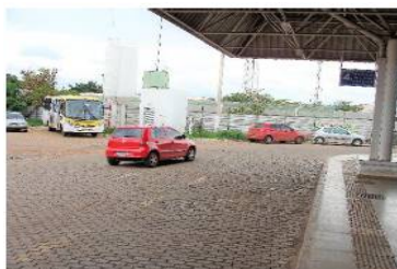
Figura 7: Veículos particulares estacionados e circulando na área restrita aos ônibus do Terminal do Paranoá.

53. No que se refere à presença de veículos particulares na área dos terminais, a constatação foi que, em quase todos os terminais (28 deles, o que corresponde a 90,3%) há essa ocorrência.