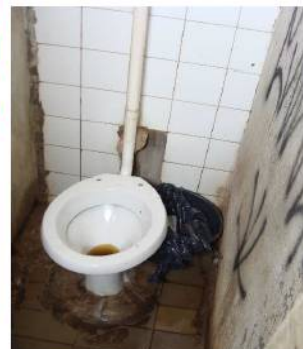
Figura 6: Sanitário sem tampa, entupido e necessitando reforma no Terminal Ceilândia P Norte

42. Apenas sete terminais oferecem bebedouro para os usuários,