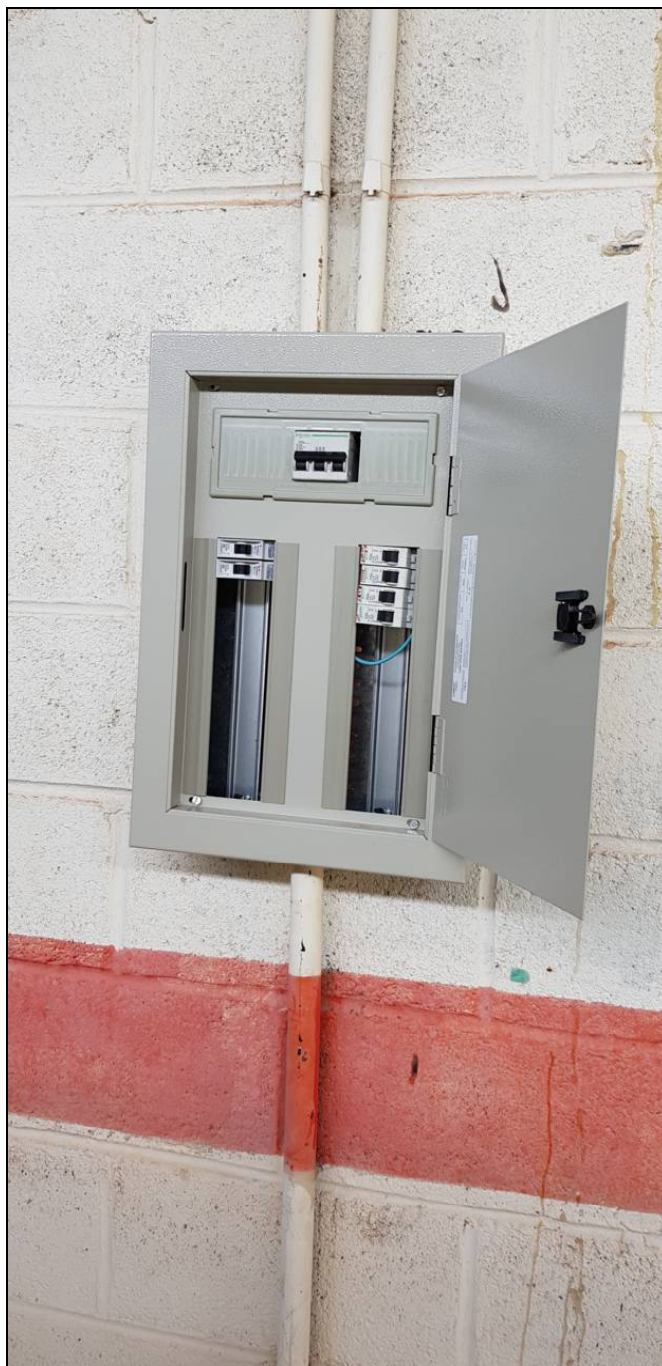
Foto 04 – Troca do quadro de energia, disjuntores, barramentos e fiação.