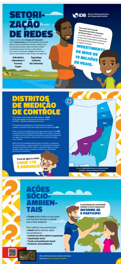
Figura 4: Exemplo – algumas das páginas acrescentadas ao material

Como forma de adequar as atividades desenvolvidas no “Canteiro Aberto” em parceria com a Superintendência de Obras (ESO) foi realizada a adaptação da cartilha “Uma viagem pelo Ciclo do Saneamento”, com acréscimo de páginas com informações relacionadas ao processo de setorização de redes da Caesb.