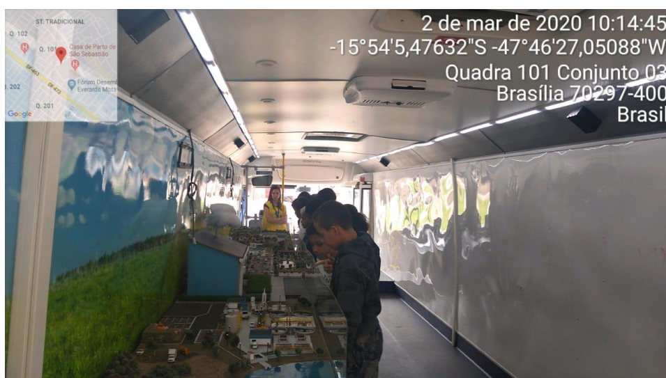
Figura 3: Atividades nos canteiros abertos à comunidade.