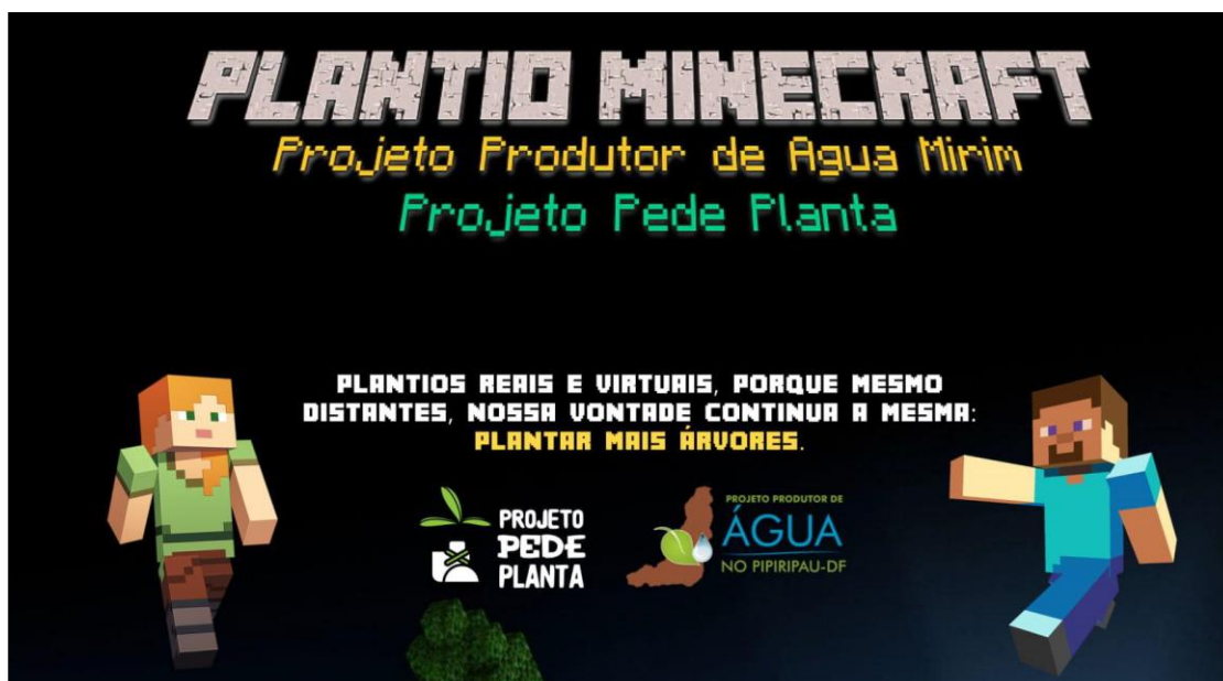
Figura 5: Apresentação do plantio virtual do Projeto Produtor de Água Mirim.

Ao longo dos meses de novembro e dezembro de 2020 foi realizado um plantio virtual e real de 5 mil mudas de espécies nativas do cerrado em propriedades rurais da bacia do Pipiripau. De forma paralela ao plantio real, foi também possibilitada a participação de estudantes de escolas públicas e particulares da região do Pipiripau por meio do game Minecraft projetando uma realidade virtual para educação remota, simulando a escola, a propriedade rural, a área de plantio e as estradas que conectam estas localidades.