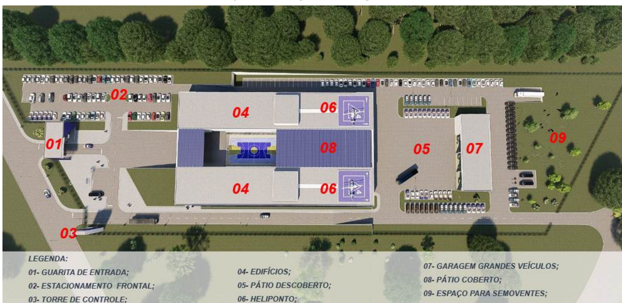
Figura 2 – Estudo preliminar de implantação.